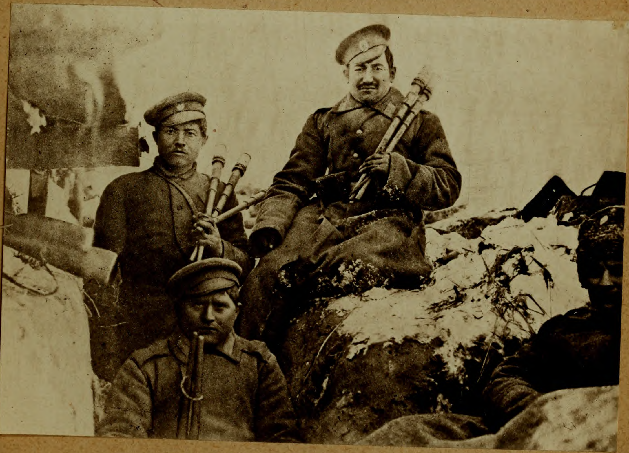
Окопы въ Польшѣ. Съ ручными бомбами.